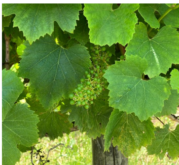
← Carnac Chardonnay