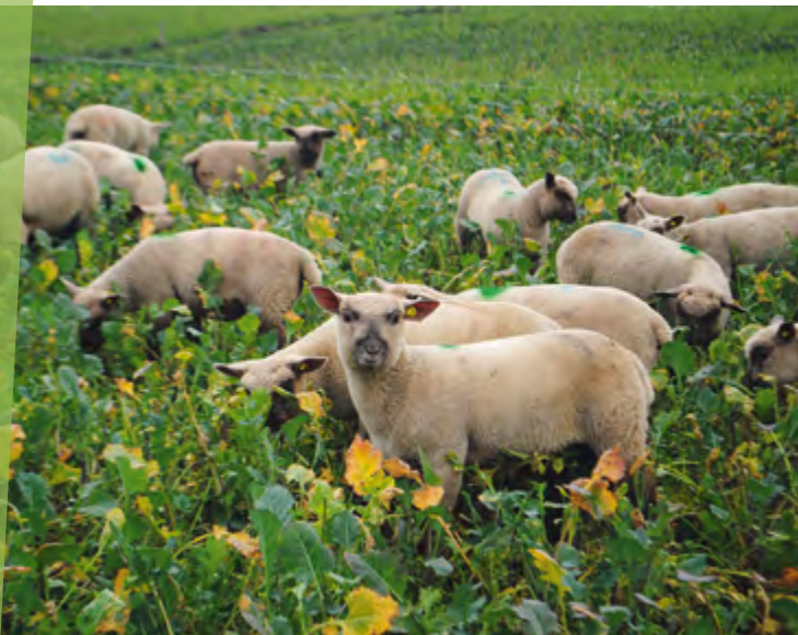
Finir des agneaux en hiver sur des couverts végétaux sans concentré

Le second levier consiste à avoir davantage recours au pâturage, dans la mesure du possible. En période de pousse, l'herbe pâturée couvre les besoins des brebis à tous les stades physiologiques. L'herbe d'hiver en dehors des zones de hautes montagnes peut être exploitée par les brebis à faibles besoins (milieu de gestation et tarées) et les agnelles de renouvellement. Le troupeau peut également bénéficier d'opportunités avec d'autres surfaces que les prairies, sur l'exploitation ou bien en dehors.